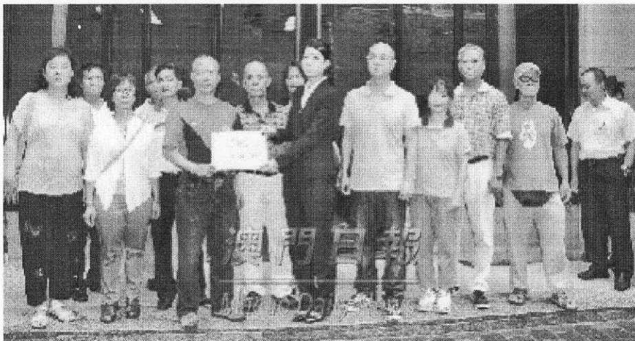
附圖七：工人自救會遞信要求政府出辣招遏止樓市炒風