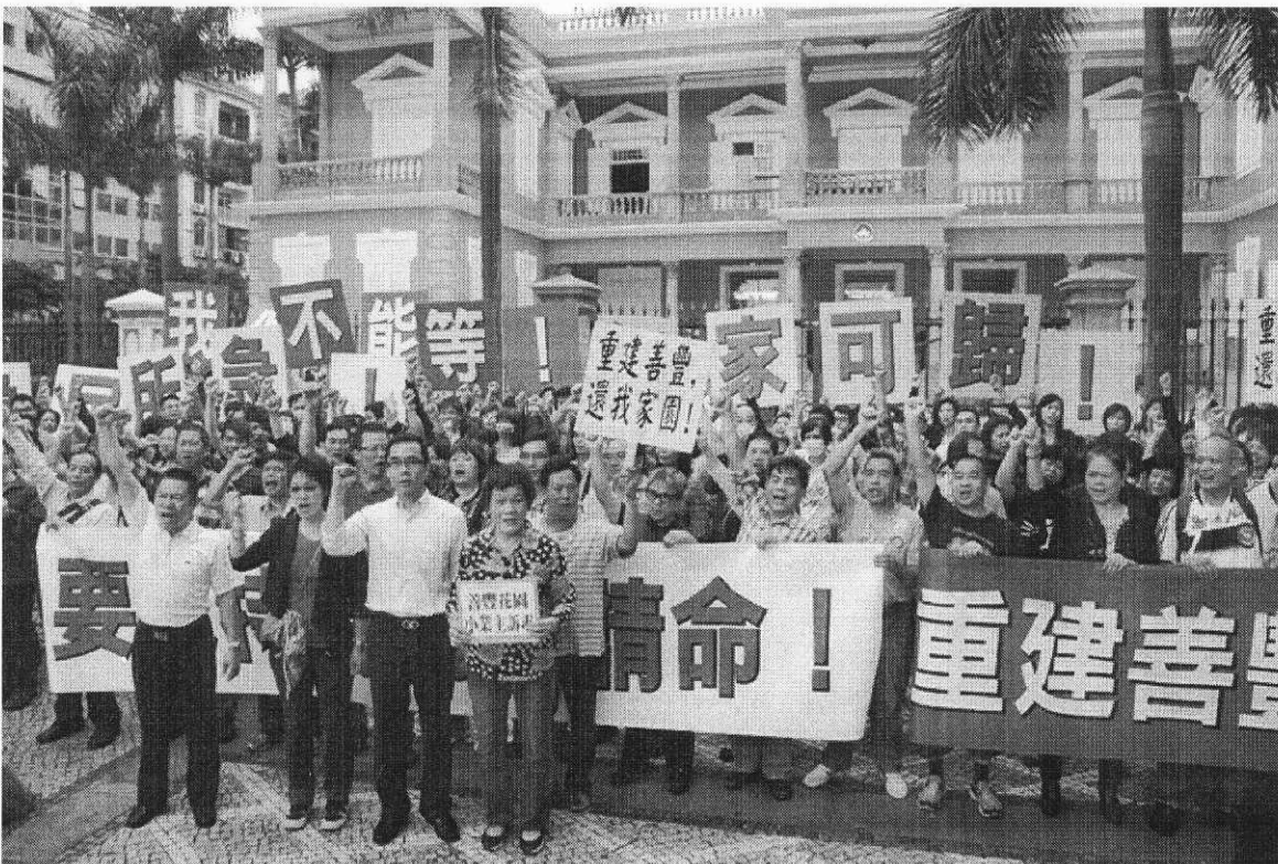
附圖一：2013年4月29日 街坊總會聯同善豐花園業主前往政府總部遞信