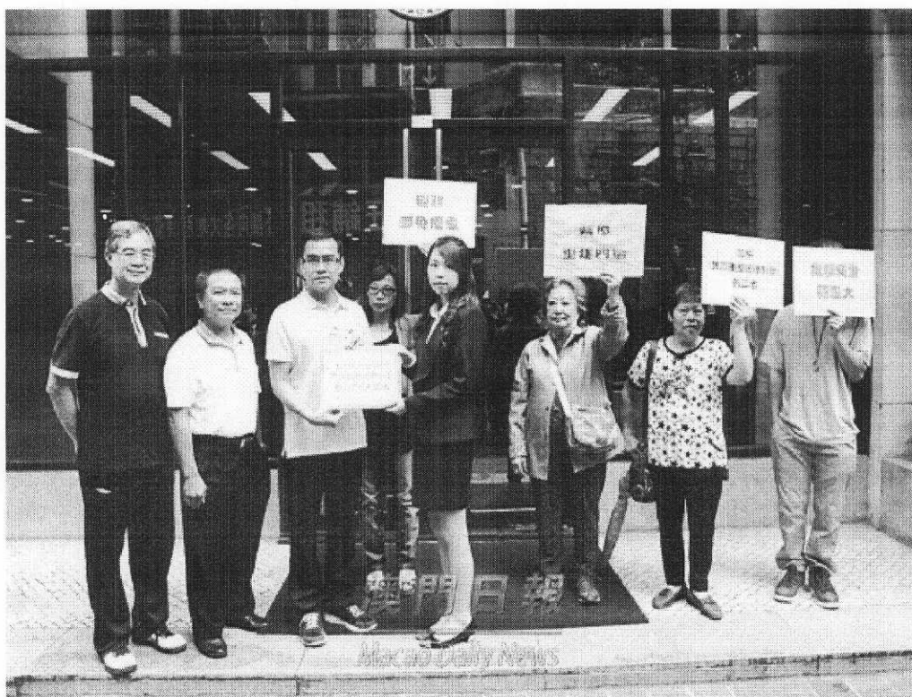
附圖三：2014年2月25日 街總促角子機場遷離社區