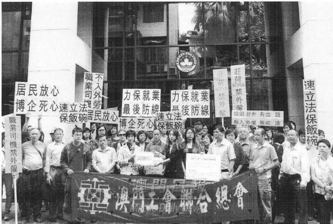
附圖五：2013/08/31：民建聯幾十人遞信要求設立全民基金公司